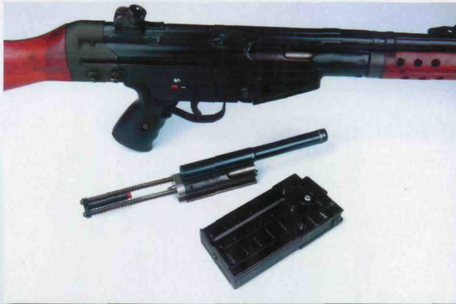
Das Kleinkaliber-System der Uhl GmbH aus Syrgenstein.

durchaus sehen lassen. Denn das kurze M41/22 realisierte das absolute Spitzenergebnis von 11 mm (Schönebeck Standard), während das lange M41/22 als Topresultat eine 14 mm-Gruppe (Lapua Signum) in die Pappe stanzte. Der fähigere Selbstlader konnte mit 16 mm (Lapua Signum) und 17 mm (RWS Spezial Match) zwei weitere Streukreise unterhalb der 20 mm-Marke produzieren. Hier konnte die Standardausführung erstaunlicherweise nicht ganz mithalten, denn nach der 14 mm-Gruppe folgte nur ein 21 mm durchmessender Zehn-Schuß-Streukreis (RWS Spezial Match) als zweitbestes Ergebnis. Somit lag die Kurzausführung mit einer durchschnittlichen Schußleistung von 20,4 mm deutlich vor der Standardversion, die ein Durchschnittsergebnis von 32,2 mm ablieferte. Leider war nicht mit allen verwendeten Munitionssorten eine zuverlässige Funktion sicherzustellen. Interessant hierbei war die Tatsache, daß vereinzelt ausgeworfene Hülsen die nächste Patrone im Magazin als Ausstoßer mißbrauchten, was an den stark beschädigten Bleigeschoßspitzen abzulesen war. Dies läßt die Vermutung zu, daß eine weitere Feinabstimmung vom verschlußseitigen Auszieher und dem Ausstoßer am Magazin wohl erforderlich wäre. Wie schon bei den SAR M41-Modellen in .308 Win. angemerkt, nicht gerade als gelungen zu bezeichnen. Schwaben Arms Rottweil hat aber hier bereits für Abhilfe gesorgt, weil ab sofort alle Waffen der umfangreichen SAR M41-Baurei-